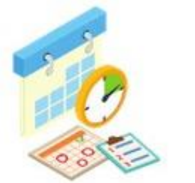
Estudios y planificación