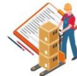
Compras y logística