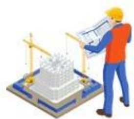
Ejecución de obra